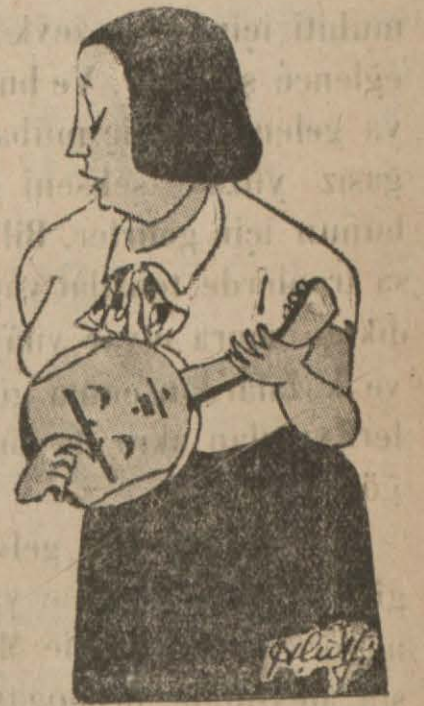
RUMBADA RUMBA RUMBA !!! KALPLERE VUR BİR ZIMBA !!!

Bunda mevkîinin müstesâhğı ve medenî vesaitle civara bağlılığında müessirdir. Fakat tabiat vergisi olan bu hususiyetlerden istifade yolu aranma-